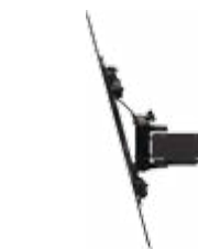
Наклон для оптимального угла обзора