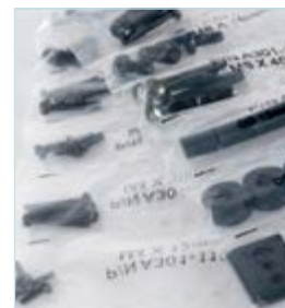
Отсортированные крепежные элементы для быстрой инсталляции