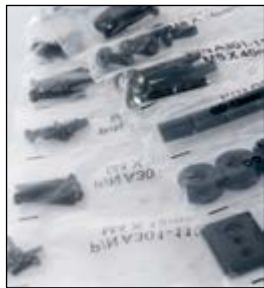
Отсортированные крепежные элементы для удобства и скорости инсталляции